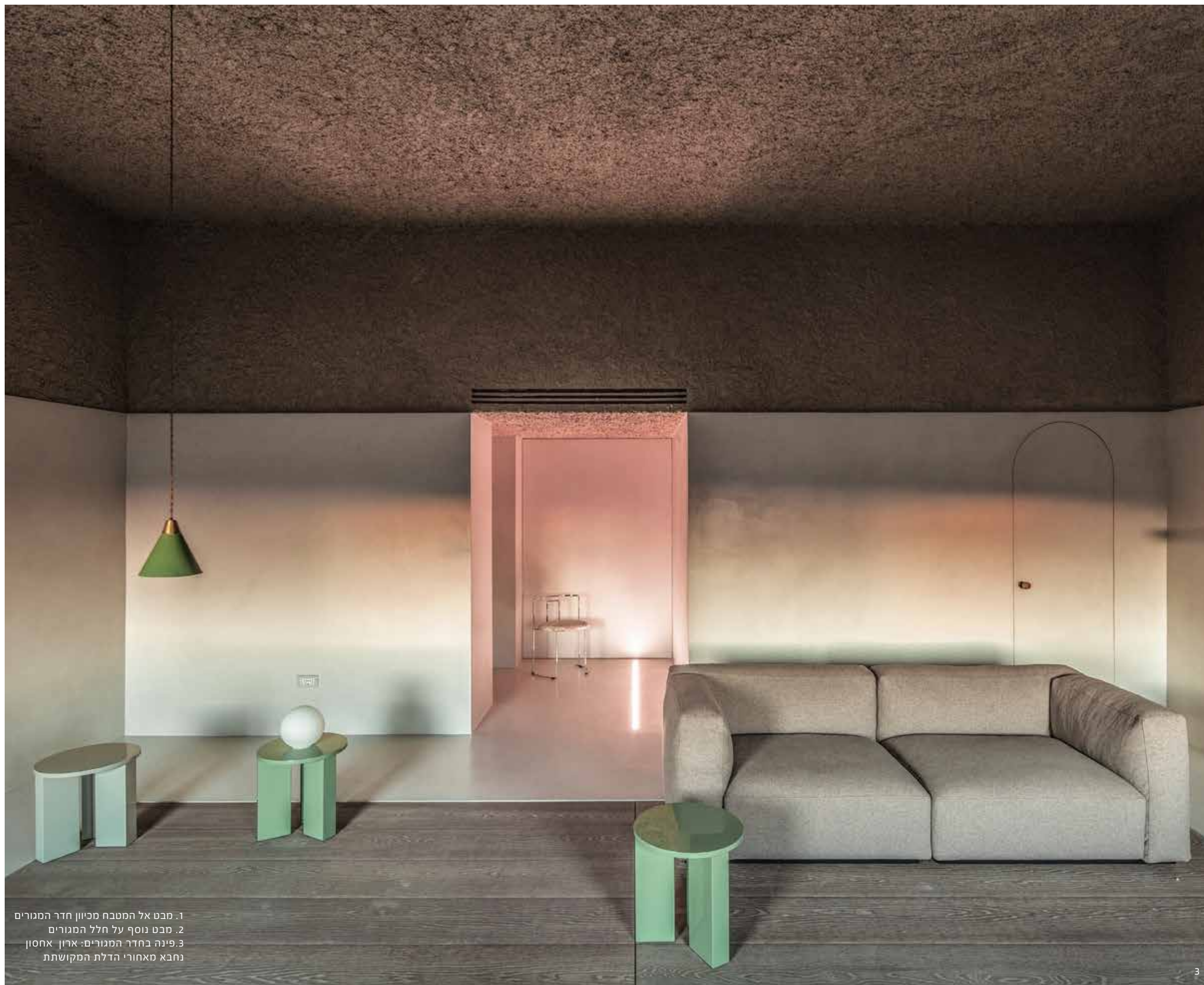
1. מבט אל המטבח מכיוון חדר המגורים 2. מבט נוסף על חלל המגורים 3. פינה בחדר המגורים: ארון אחסון נחבא מאחורי הדלת המקושטת