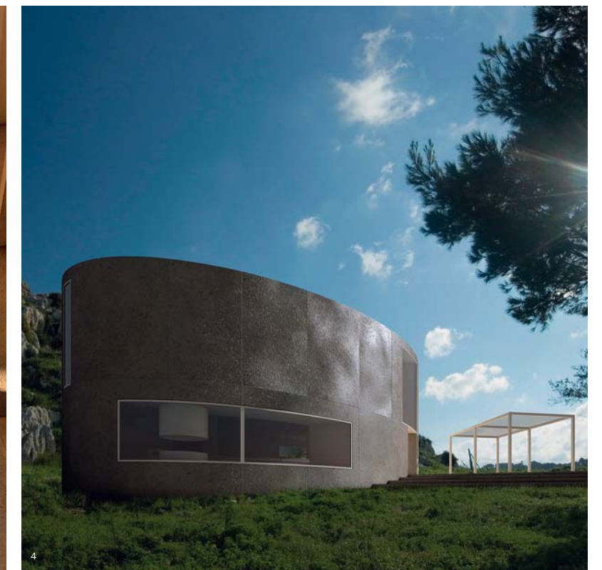
1–4. Дом «Эллипс 1501» место > Холмы близ Рима, Италия постройка > 2007 архитектор > Антонино Кардилло площадь > 140 + 80 кв. м высота > 6,30 м этажность > 2 этажа