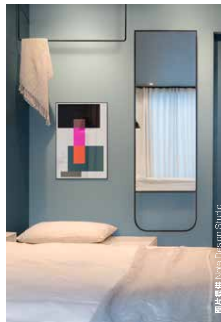
设计师别出心裁地将蓝灰色运用在卧室空间，通过一深一浅的搭配营造出节奏感，避免了冰冷的调性。装饰画的颜色则很好地平衡了整个空间，静谧之中透出一丝俏皮。

“粉彩”这一词几乎是对北欧用色的最佳概括。饱和度偏低、明度偏高的粉彩色系，能让心情愉悦，且避免了高饱和度用色容易造成的神经紧张。在空间上，倾向于大面积的色块使用，即使是对比色、撞色的搭配，也毫无违和感；在陈设中，则喜欢用饱和度高一些的彩色家具进行搭配。2008年金融危机之后陆续走红的针对高端低价市场的年轻设计师品牌，如Normann Copenhagen、Muuto和Hay等，均采用了大量高饱和度的明快色彩。