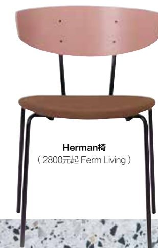
Herman椅 (2800元起 Ferm Living)