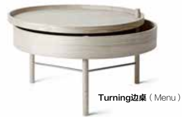
Turning 边桌 (Menu)

“北欧设计”这一概念形成于二战以后，主要指欧洲北部四国——挪威、丹麦、瑞典、芬兰的室内与家具设计，讲求功能性和以人为本，风格纯粹简洁。设计师们深受包豪斯“功能主义”的影响，却不过分拘泥于机械美学，注入了更多的情感因子，将功能主义和北欧的人文主义相互融合，产生了一种亲切自然的现代主义形式。