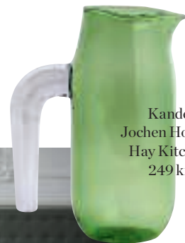
Kande, Jochen Holz for Hay Kitchen, 249 kr.