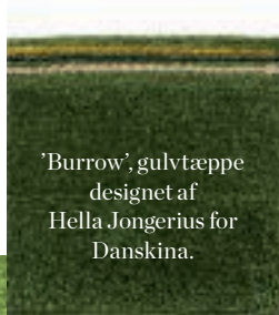
'Burrow', gulvtæppe designet af Hella Jongerius for Danskina.