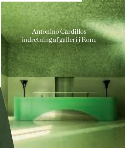
Antonino Cardillos indretning af galleri i Rom.