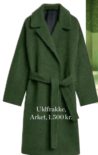
Uldfrakke, Arket, 1.500 kr.