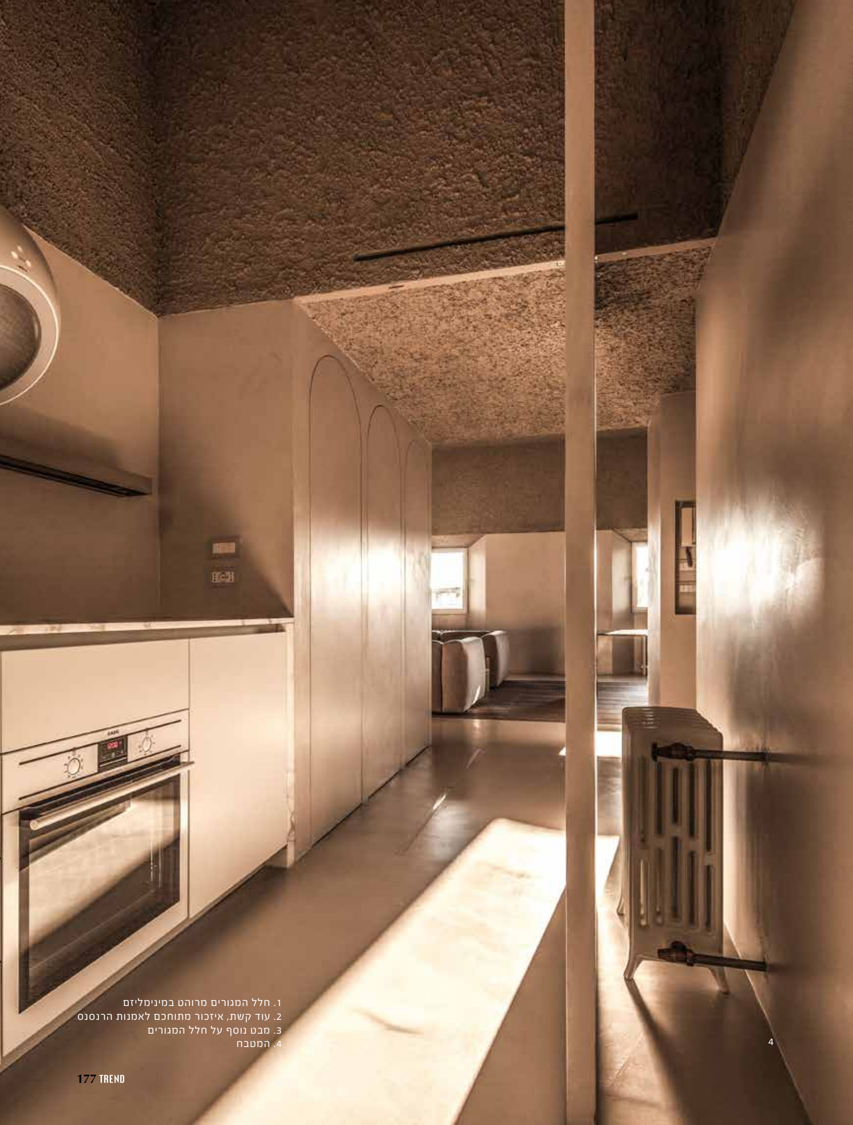
1. חלל המגורים מרהט במינימליזם 2. עוד קשת, איזכור מתוחכם לאמנות הרנסנס 3. מבט נוסף על חלל המגורים 4. המטבח