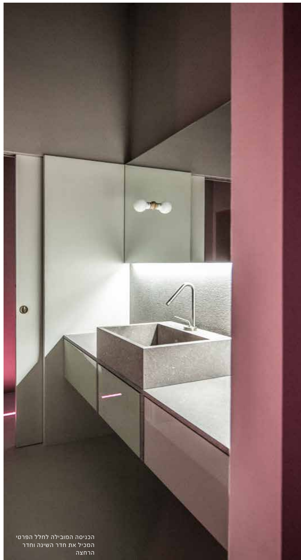
הכניסה המובילה לחלל הפרטי המכיל את חדר השינה וחדר הרחצה