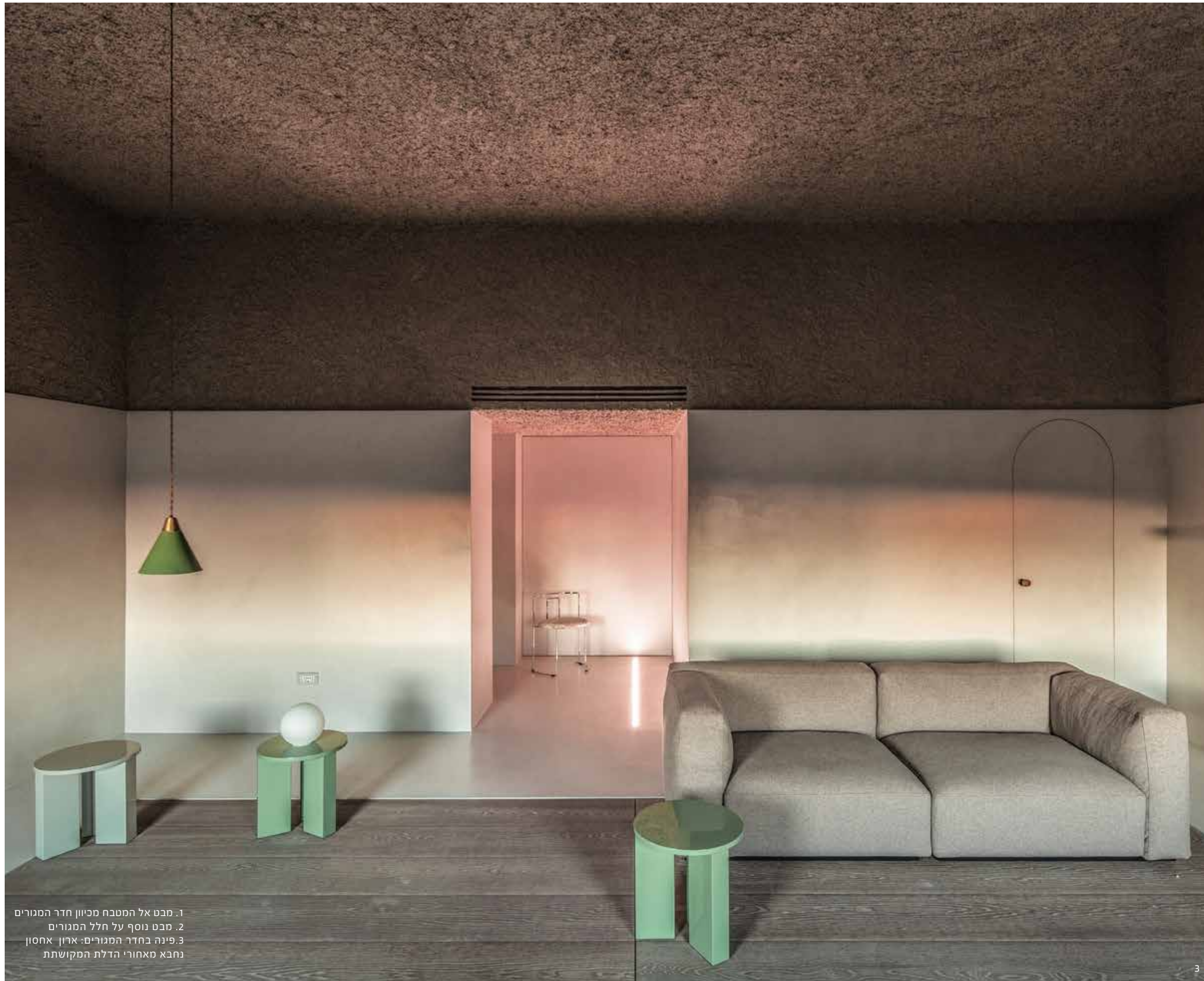
1. מבט אל המטבח מכיוון חדר המגורים 2. מבט נוסף על חלל המגורים 3. פינה בחדר המגורים: ארון אחסון נחבא מאחורי הדלת המקושטת