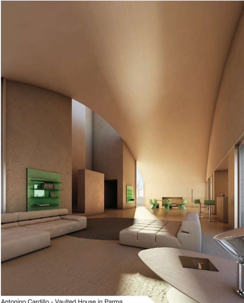
Antonino Cardillo - Vaulted House in Parma