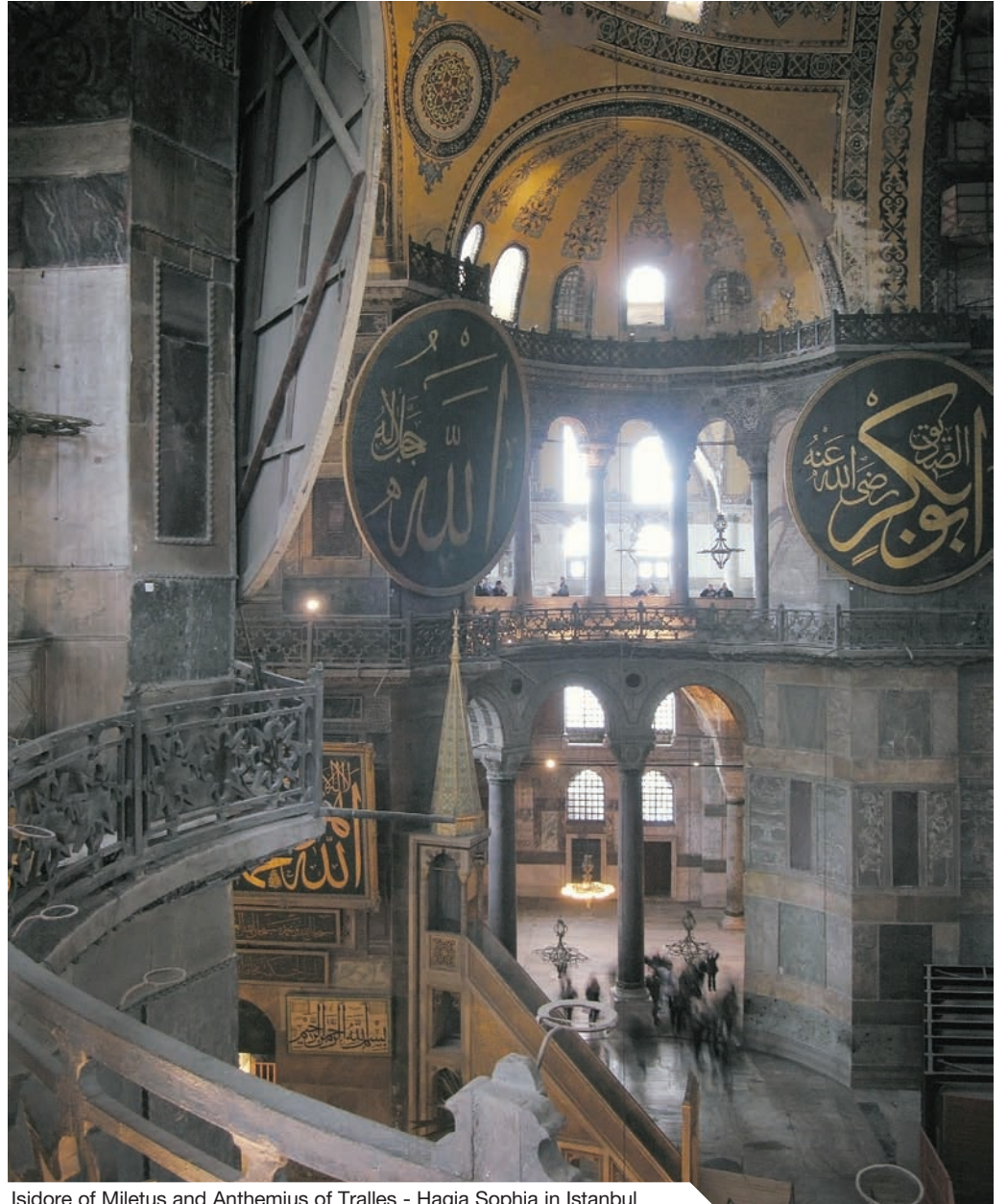
Isidore of Miletus and Anthemius of Tralles - Hagia Sophia in Istanbul

Fakat her yapı ışığı dinlemez. Bizim mimari tabiri ettiğimiz o yanardöner, ışıklı ağın içine sadece opak malzemeler girer. Diğer yandan, paradoksal olarak, cam kutu, ışığı dönüştüremediğinden dolayı, onu reddeder. Mimarının ışığı yorumlamak, yönlendirmek, günümüzün düz, gözenekli, yarı şeffaf, yansıtımlı yüzeyleri arasında kompleks diyaloglar oluşturmak şeklindeki temel amacını göz ardı eder. Kısacası, mimarının varoluş nedenini inkar eder.