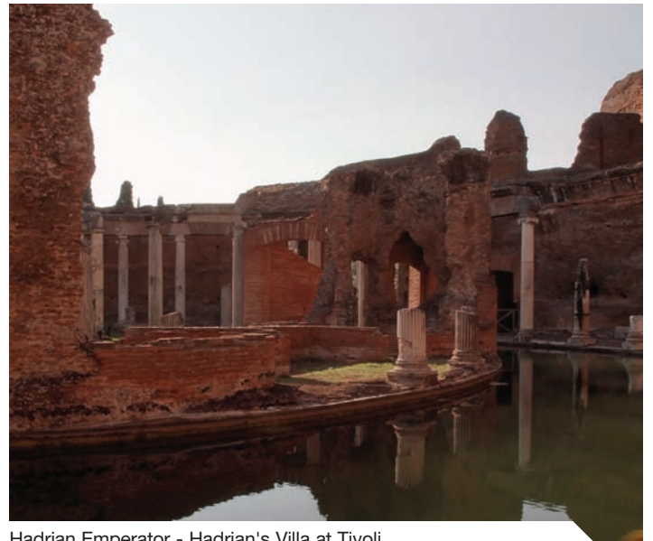
Hadrian Emperor - Hadrian's Villa at Tivoli

■ Sometimes architecture is all the more interesting, the more invisible or concealed it is. When it is not only made up of that which can be seen and touched, but rather that which suggests and leaves the rest to the imagination. In some ways architecture is not just lived-in space but also imagined space. Inside it space is not crossed with the body alone but some of its parts become meaningful precisely because they are unknown to the body, thus becoming places of the mind, open to many readings: how else can the sense of certain unreachable places be explained? Like the dark ravine of a cathedral or as, by means of a different interpretation, for the ruins of the Villa Adriana, where the unknown is more powerful and evocative than