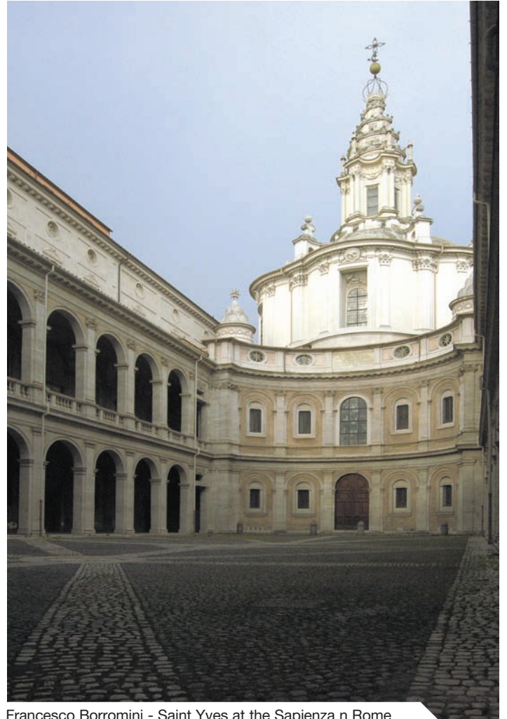
Francesco Borromini - Saint Yves at the Sapienza in Rome