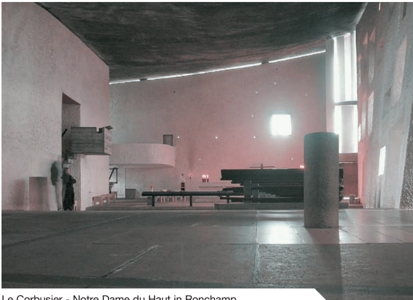
Le Corbusier - Notre Dame du Haut in Ronchamp