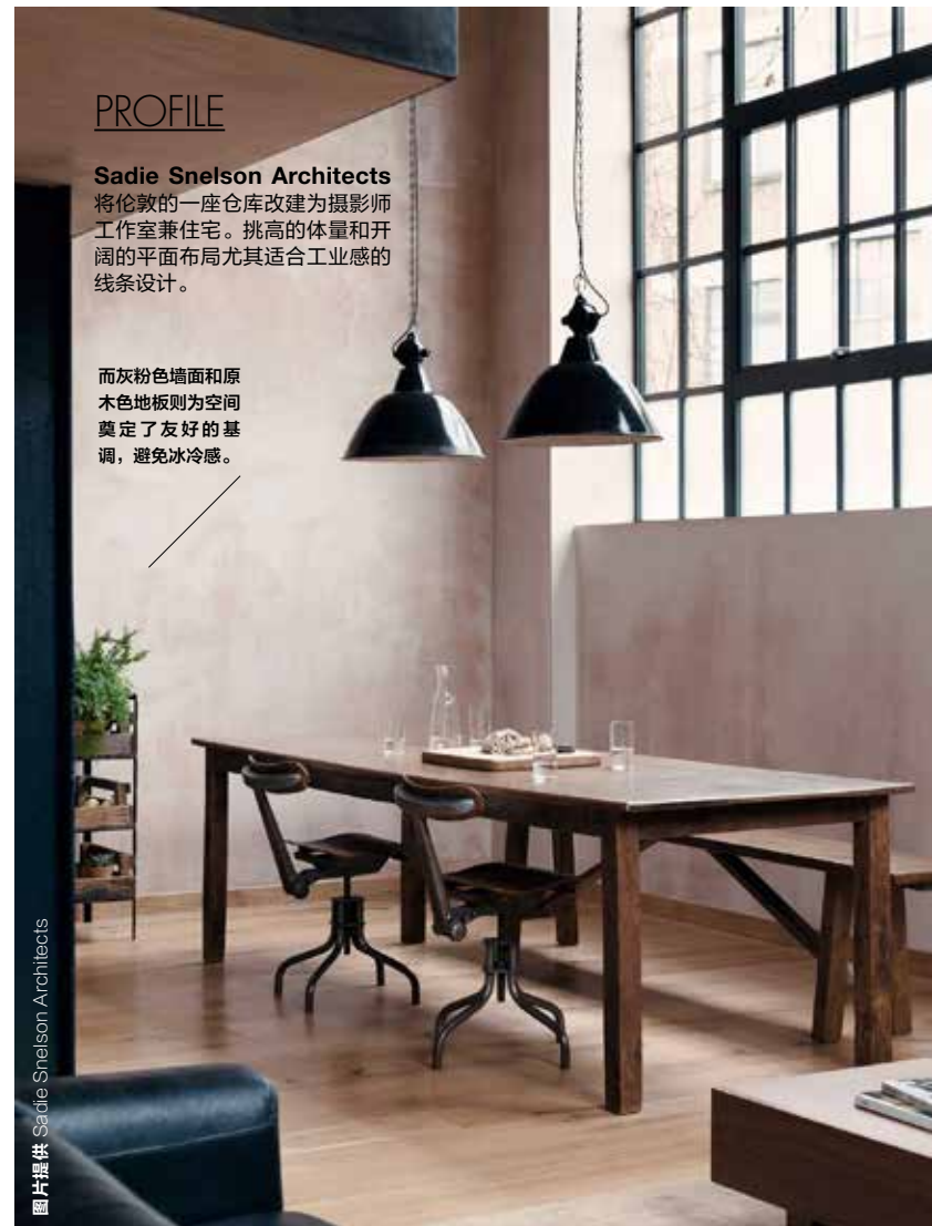
图片提供 Sadie Snelson Architects

就像前几年时尚圈大热的Normcore风潮，北欧风格里的黑白灰、工业感亦是绕不开的话题。在空间上，北欧设计师们趋向于放弃装饰，转而在平面构成的线条、色块来区分点缀。反应在家具上，一种是充满现代线条的modern style，另一种则是自然柔美的nature style。