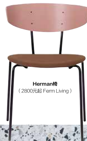
Herman椅 (2800元起 Ferm Living)