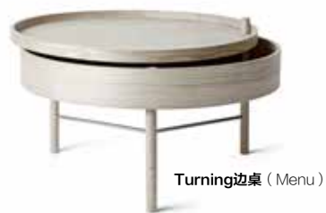
Turning 边桌 (Menu)

“北欧设计”这一概念形成于二战以后，主要指欧洲北部四国——挪威、丹麦、瑞典、芬兰的室内与家具设计，讲求功能性和以人为本，风格纯粹简洁。设计师们深受包豪斯“功能主义”的影响，却不过分拘泥于机械美学，注入了更多的情感因子，将功能主义和北欧的人文主义相互融合，产生了一种亲切自然的现代主义形式。