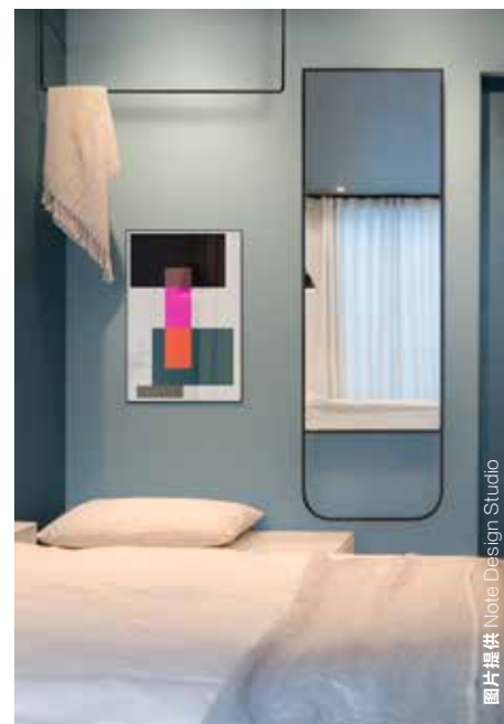
设计师别出心裁地将蓝灰色运用在卧室空间，通过一深一浅的搭配营造出节奏感，避免了冰冷的调性。装饰画的颜色则很好地平衡了整个空间，静谧之中透出一丝俏皮。

“粉彩”这一词几乎是对北欧用色的最佳概括。饱和度偏低、明度偏高的粉彩色系，能让心情愉悦，且避免了高饱和度用色容易造成的神经紧张。在空间上，倾向于大面积的色块使用，即使是对比色、撞色的搭配，也毫无违和感；在陈设中，则喜欢用饱和度高一些的彩色家具进行搭配。2008年金融危机之后陆续走红的针对高端低价市场的年轻设计师品牌，如Normann Copenhagen、Muuto和Hay等，均采用了大量高饱和度的明快色彩。