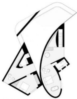
pianta piano terra/ground floor plan

nome progetto/project name House of Convexities progetto/design Antonino Cardillo luogo/place Barcellona, Spagna fine lavori/completion 2008 superficie/area 230 + 130 mc/sqm (su due livelli/on two levels) www.antoninocardillo.com